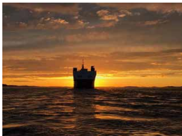
Solen gikk ned for Gannturene 2020