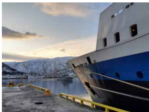
Gann til Kai i Narvik

Når vi ser tilbake på situasjonen mener vi at vi har håndtert dette på en god måte. Vi har vært i dialog med myndigheter, havner og samarbeidspartnere i hele prosessen. Tilbakemeldingene fra våre kunder er at det var en ryddig og åpen prosess.